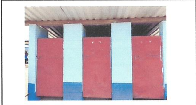
Foto 2: Puertas de las letrinas de pozo ciego muy cercanas a la pila y aulas