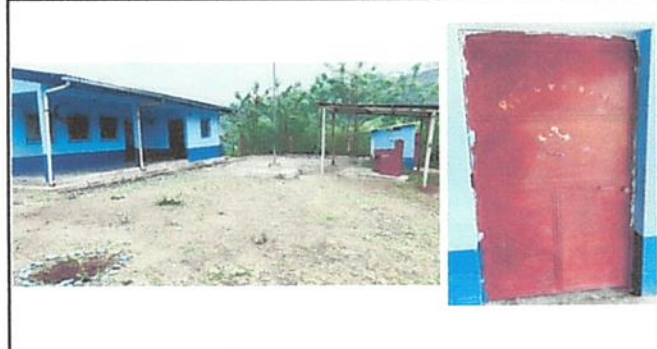
Foto 4: Puertas y ventanales deteriorados de la escolita, aunque se ve la pintura de la misma en buen estado es porque recientemente fue pintada en el exterior por personas de la comunidad